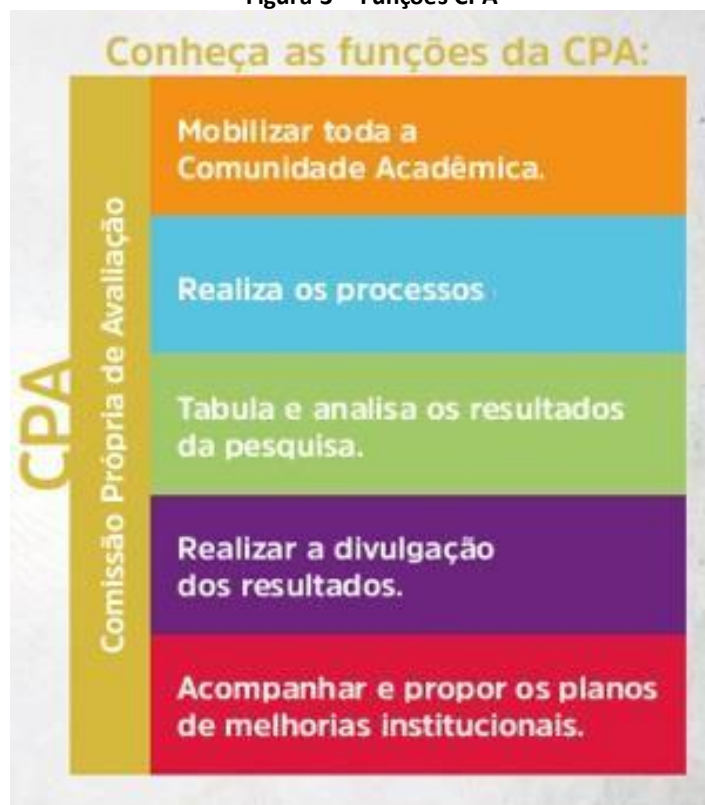
Figura 3 – Funções CPA